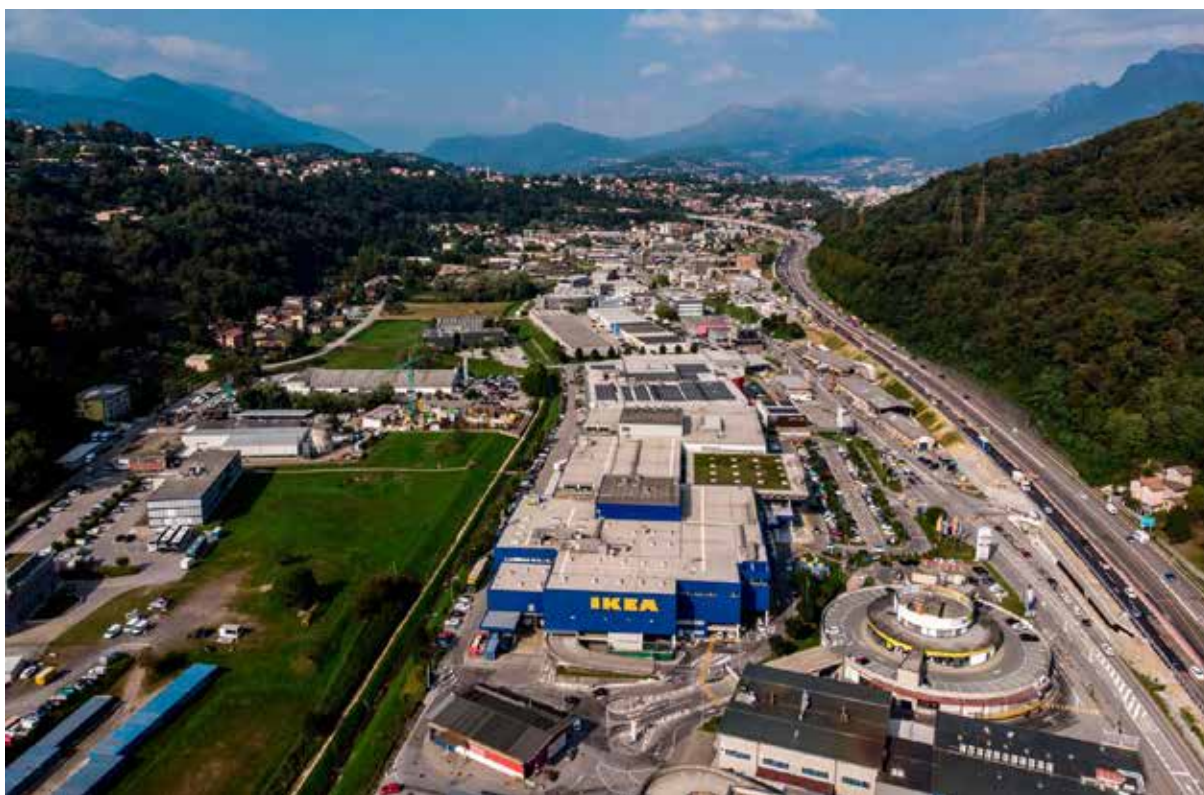
(Fig. 4) Nel 2016 i tre comuni cui appartiene il Pian Scairolo (Lugano, Grancia, Collina d'Oro) approvano il Piano Regolatore Intercomunale (PRI) di questo comparto territoriale, assunto a emblema di uno sviluppo caotico e non coordinato con le infrastrutture per la mobilità, con il conseguente sovraccarico della rete viaria e il suo quasi collasso. Il PRI, molto controverso, prevede che i posti di lavoro potranno raggiungere ben 6'900 unità e gli abitanti solo 1'800, contraddicendo l'obiettivo di avvicinare posti di lavoro e abitazioni per limitare la mobilità pendolare. Le superfici di vendita potranno raggiungere 127'700 mq, accentuando la concorrenza ai commerci del centro città. Sembra incredibile ma, al momento di decidere il PRI, non erano noti i dati del momento per poterli confrontare con quelli prospettati. Era solo noto che i piani regolatori precedenti autorizzavano una SUL (superficie utile lorda degli edifici) di circa 648'000 mq, mentre il PRI ne autorizzava 781'000: 133'000 in più (+20%) benché solo la metà di quella già possibile fosse sfruttata. La specializzazione del Pian Scairolo è indubbiamente il commercio, all'ingrosso e al dettaglio, ma non mancano industrie, artigiani e altri servizi. Con la pubblicazione del "Programma d'agglomerato del Luganese di terza generazione", del 31.10.2016 ( http://www.pal3.ch/pdf/PAL3_docA_RapportoEsplicativoFinale.pdf ), a p. 109 si può leggere che nella zona denominata "Porta Sud" (il Pian Scairolo), nel 2012 vivevano 1'600 persone e i posti di lavoro erano 4'600 (nel 2011); l'obiettivo al 2030 sarebbe di 1900 abitanti (+12,5%) e di 7'000 posti di lavoro (+52%).

infrastrutturali dedicate alla mobilità in quest'area e fra questa, più quella residenziale del Malcantone, e il Polo cittadino: la circonvallazione di Agno e Bioggio e la rete Tram-Treno con la nuova galleria fra Bioggio e Lugano. Infine, la funzione a lungo termine dell'aeroporto di Agno e la destinazione dei suoi 30 ettari di terreno è sempre oggetto di riflessioni, ed è bene che lo sia.