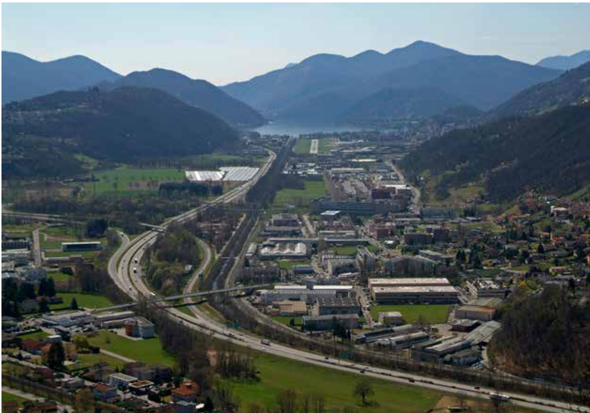
(Fig. 5) Il Basso Veduggio è, dopo la Città di Lugano, la principale area produttiva dell'agglomerato. I suoi abitanti sono solo il 6% di quelli dell'agglomerato, ma le sue aziende il 7%, i suoi posti di lavoro il 14% e i frontalieri il 19% di tutti quelli che lavorano nell'agglomerato. Anche il Medio Veduggio ha un peso consistente nell'agglomerato: 7% della popolazione, 7% delle aziende, 8% dei posti di lavoro, 11% dei frontalieri. Il settore secondario (industria e costruzioni) è sovra-rappresentato rispetto alle altre aree dell'agglomerato: il 19% dei posti di lavoro del secondario nell'agglomerato sono nel Basso Veduggio e il 18% nel Medio Veduggio. Ma anche in queste due aree i posti di lavoro nei servizi sono nettamente più numerosi di quelli nel secondario: 12'000 su 15'900 nel Basso Veduggio, 5'400 su 9'200 nel Medio Veduggio.

estremamente elevati. Sommando quelli dei frontalieri e dei pendolari (interni, in entrata e in uscita) arriviamo a 81'500; aggiungendo gli spostamenti casa-lavoro di chi vive e abita nel medesimo comune, 109'800. A questi si aggiungono i tragitti casa-scuola e gli spostamenti non sistematici (acquisti, visite, svago).