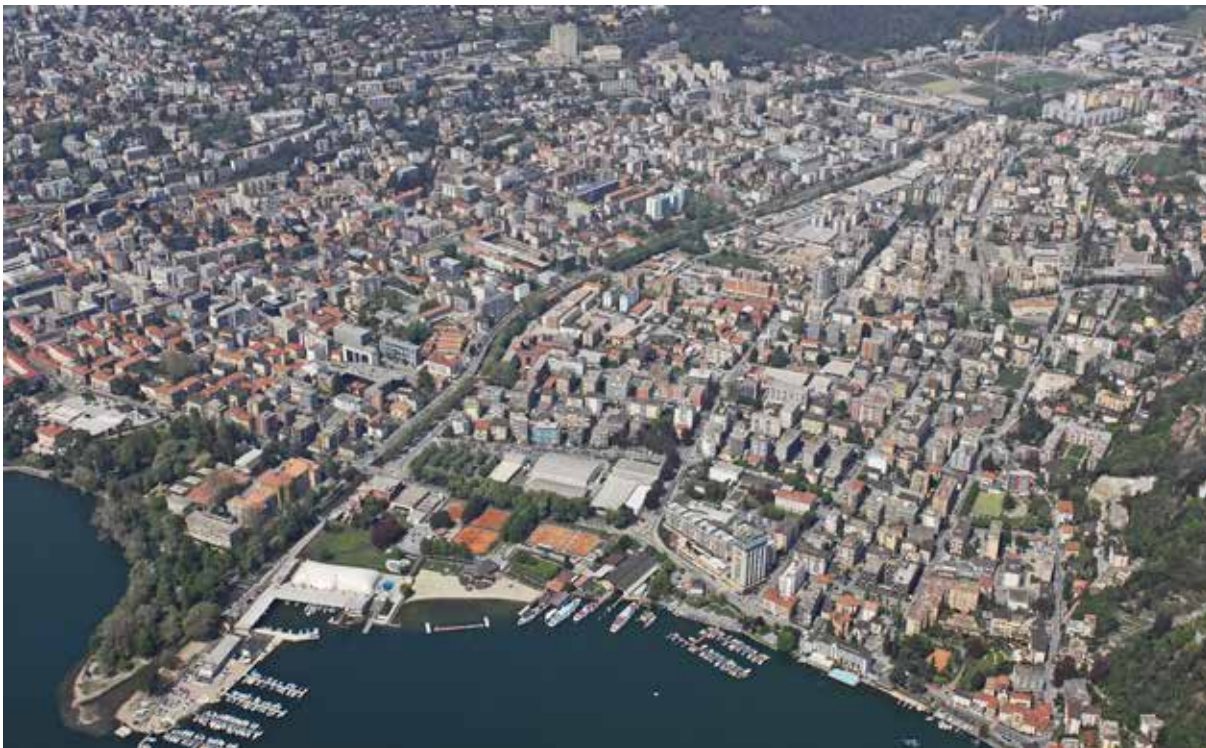
(Fig. 3) La forte densità (abitanti, posti di lavoro, posti letto in alberghi e istituti di cura) dell'area centrale di Lugano ne fa la forza trainante dell'agglomerato. Ma è solo una parte della Città: il nuovo Piano Direttore comunale, in gestazione, definisce Lugano una "Città di villaggi e quartieri". Si estende dalla Val Colla a Figino su un percorso di una trentina di chilometri e la sua superficie complessiva è di 76 kmq. La sua superficie boschiva e di svago supera i due terzi della superficie totale. La densità è una ricchezza (prossimità, varietà) che comporta dei rischi, presenti anche nella dispersione incontrollata degli insediamenti nell'agglomerato. Rischi per l'ambiente, le relazioni sociali, l'economia: saturazione del territorio, perdita di qualità, esplosione dei prezzi fondiari, collasso della mobilità. Alcune funzioni economiche tipiche di una città sono concentrate in quest'area centrale: il principale gruppo di attività, con il 24% degli impieghi totali a Lugano, è quello dell'amministrazione pubblica, dell'istruzione, della sanità e dei servizi sociali (13'700 dei 56'800 posti di lavoro nella città). Pure situate prevalentemente in quest'area sono le attività specialistiche, scientifiche e tecniche e di servizio alle imprese: 12'100 addetti, 21% degli addetti totali di Lugano.

nelle molte "aree funzionali" in cui il committente dello studio (la CRTL) ha suddiviso l'Agglomerato per le sue necessità: ben 21 aree, raggruppate in 13 nello studio di Rossi. Sono forse troppe per un'analisi economica 8) . Trattiamo qui le tre aree più importanti per l'economia dell'AUL.